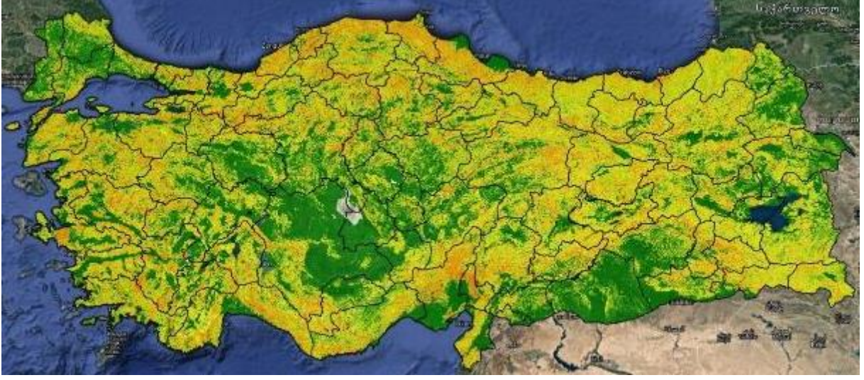
Şekil 3. Türkiye Heyelan Duyarlılık Haritası

2019 yılı içerisinde ise toplamda 245 heyelan/kaya düşmesi olayı meydana gelmiştir. Trabzon 102 heyelanla ilk sırada yer almıştır. Trabzon'u 33 olayla Zonguldak, 11 olayla Çorum, 9 olayla Mersin ve 8'er olayla İzmir ve Kocaeli illeri izlemektedir. Buna karşın 42 ilde ise 2019 yılı içerisinde hiçbir heyelan/kaya düşmesi olayı kaydedilmemiştir.