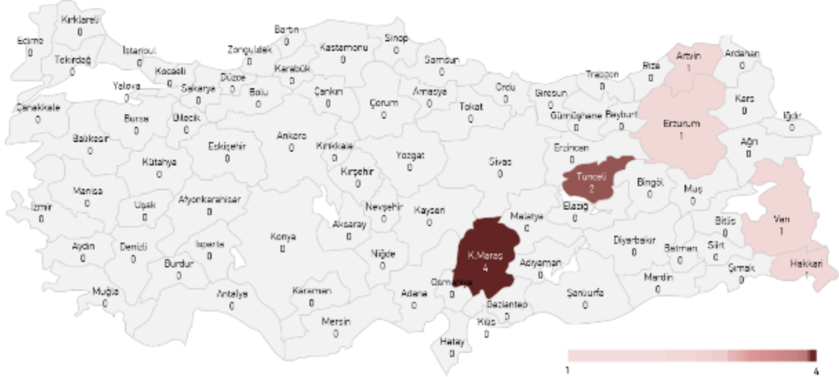
Şekil 5. 2019 yılında Türkiye’de meydana gelen çığ olaylarının il bazında sayıları

2019 yılı içerisinde ise toplamda 10 çığ olayı meydana gelmiştir. Kahramanmaraş 4, Tunceli 2, Artvin, Erzurum, Van ve Hakkâri ise birer çığ olayı yaşamıştır.