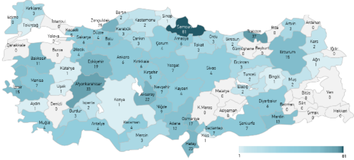
Şekil 4. 2019 yılında Türkiye’de meydana gelen sel/su baskını olaylarının il bazında sayıları

2019 yılı içerisinde ise toplamda 499 sel/su baskını olayı meydana gelmiştir. Samsun 81 heyelanla ilk sırada yer almıştır. Samsun’u 37 olayla Trabzon, 33 olayla Afyonkarahisar, 25 olayla Zonguldak ve 22 olayla Aksaray takip etmektedir. Buna karşın 19 ilde 2019 yılı içerisinde ise hiçbir sel/su baskını olayı kaydedilmemiştir.